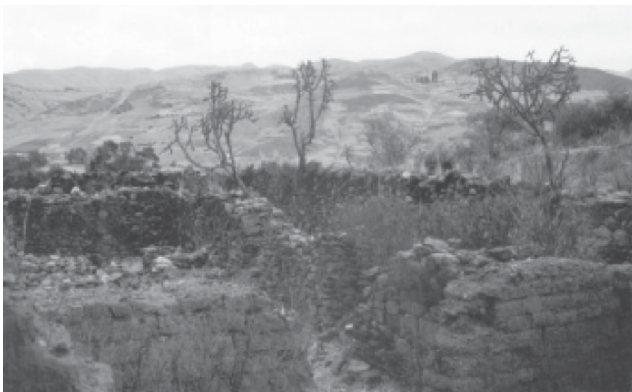
Foto 4. Detalle de reocupaciones posteriores del sitio

con la arquitectura circundante. Nos inclinamos a designar a este edificio por comparación con otros asentamientos Inka con el Templo del Sol .