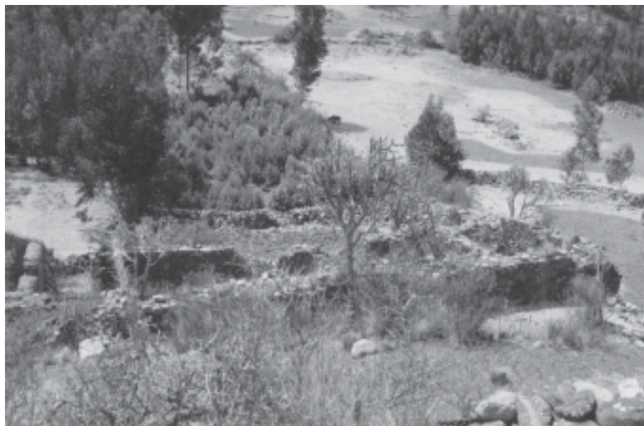
Foto. 2 Kancha principal

una mampostería del tipo poligonal-celular, aunque de factura más bien burda, habiendo sido unidos los bloques con argamasa de barro. Los accesos son altos y de forma trapezoidal, lo mismo que los nichos. (Foto 3). Este edificio se encuentra en muy buen estado de conservación no obstante, en un patio posterior se ha removido la tierra seguramente con fines de cultivo. Gracias a esto se reconoció gran cantidad de fragmentos cerámicos, algunos pertenecientes a aribalos . La función original de esta kancha debió haber sido de vivienda de los miembros de la élite que dirigía y controlaba el asentamiento y la administración local, lo que es confirmado por las características del edificio en mención, es decir, por su cuidadosa repetición de elementos distintivos Inka: accesos y hornacinas de forma trapezoidales, muros de buena factura, presencia de cerámica con forma aribaloide, ubicación dentro del asentamiento, etc. Además, ha habido una reocupación de la kancha , posterior al funcionamiento del asentamiento, y donde se han separado ambientes prehispánicos a través de la construcción de muros hechos con adobes de tamaño mediano que afectan la forma rectangular. Pensamos que fueron realizados en la temprana Colonia y que representarían la primera fundación de Recuay utilizando la ciudad Inka, para reunir allí a la población local (Foto 4).