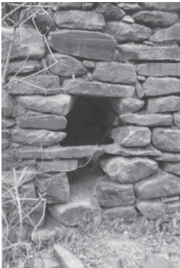
Foto 3. Nichos Trapezoidales en las estructuras

que le confiere un aspecto piramidal. A la parte superior se accede mediante una escalinata formada por pasos hechos con piedras canteadas sobre la superficie preparada de la ladera del cerro. Esta escalinata es de acceso restringido, la cual no se encuentra en la plaza sino en una calle perpendicular al camino principal. En la parte superior del promontorio se encuentra un recinto de planta rectangular dentro del cual hay dos subdivisiones menores, que ofrecen asimismo una idea de restricción al paso y, consecuentemente, habría que pensar en su importancia por las actividades reservadas que allí se llevarían a cabo. Esta estructura se encuentra muy destruida y el acceso que debió tener cierto arreglo, como vanos trapezoidales, no se conserva. Nos parece que este edificio debió tener una función relacionada al culto y/o control del asentamiento. Decimos esto, por no presentar definitivamente características para ser un lugar de vivienda de manera permanente además de, estar ubicado en un sector privilegiado, dominando el paisaje y aprovechando la topografía natural en un sentido utilitario, integrándolo