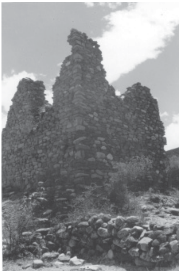
Foto 1 Esquina sur-oeste del edificio alto de Pueblo Viejo